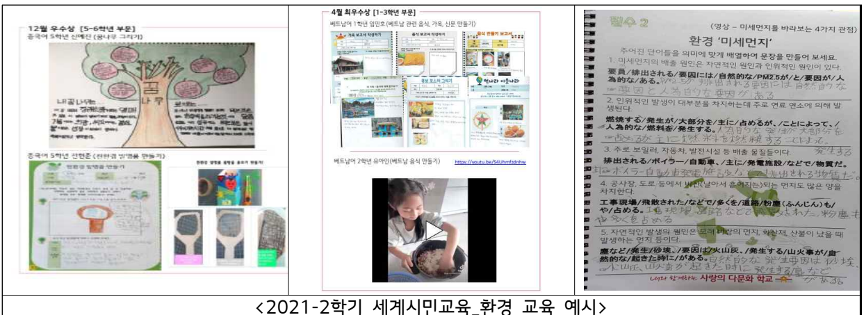
<2021-2학기 세계시민교육_환경 교육 예시>